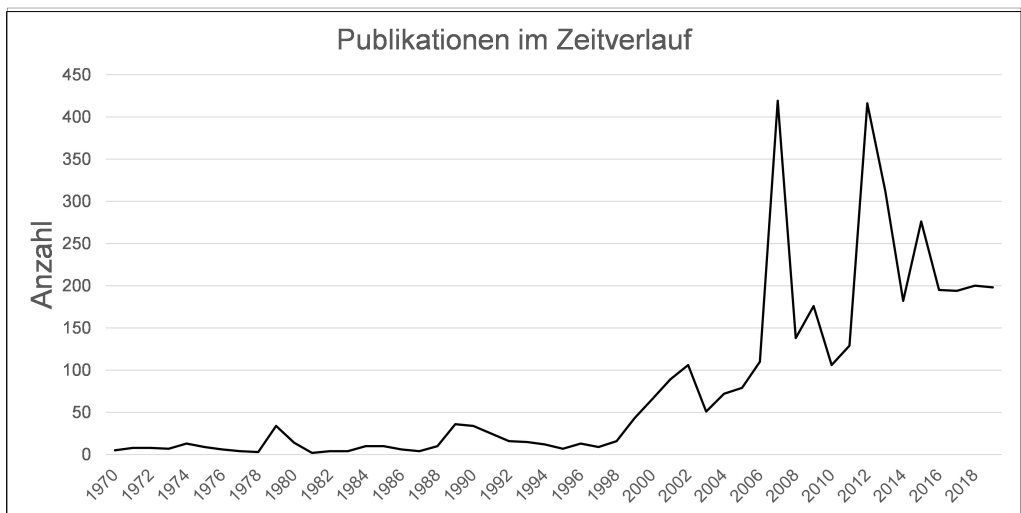
Abbildung 1: Konjunktur der medialen Diskussion um die U3-Betreuung in der FAZ

Festzuhalten bleibt damit, dass erst mit der Jahrtausendwende die (außer-)familiale Betreuung von Kindern unter drei Jahren in den medialen Fokus geriet und seitdem einen festen Stellenwert in der Berichterstattung einnimmt. Außerfamiliale Bildung, Betreuung und Erziehung von Kindern unter drei Jahren sind seit diesem Zeitpunkt keine privaten Angelegenheiten mehr, sondern erlangten zunehmend die öffentliche Aufmerksamkeit.