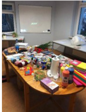
Abb. 1 & 2: Materialtisch des ersten Bodymap-Workshops & Abzeichnung einer Körpersilhouette (BOND Projekt)

Die Workshopteilnehmer*innen setzten sich dabei mit spezifischen Fragestellungen auseinander, die sowohl die Selbstwahrnehmung als auch die soziale Verortung betrafen. In den sieben Workshops, die die Studierenden vorbereitet und durchgeführt haben, wurden je nach Zielgruppe unterschiedliche Fragestellungen in die Workshopkonzeption integriert, um persönliche Perspektiven, emotionale Bezüge sowie sprachlich-kulturelle Erfahrungen