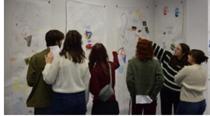
Abb. 6 & 7: Studierende betrachten die Bodymaps an der Vernissage am 31.01.2025 im OPEN Space Chemnitz (BOND Projekt)